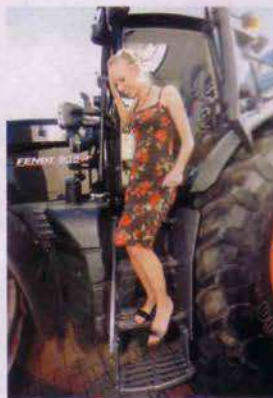
¿Quién decía que a las rubias sólo les gustan los deportivos?

Número 58, página 52 Que el Fendt es apto para excavar es algo fuera de toda duda, pero que no sabíamos es que también es un imán para muchas miradas. Más de una chica, como la de la foto de abajo, nos paró para curiosarse en el interior de la cabina.