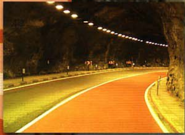
Camarasa (Lleida), Ctra. C-13, pk. 47

Uno de los temas que más preocupa a la Asociación Mutua Motera es la seguridad. Es por ello que muchas de nuestras iniciativas y proyectos van encaminados a investigar las principales causas de siniestralidad de nuestro sector y a reducir sus consecuencias.