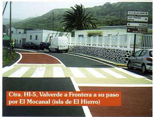
Ctra. HI-5, Valverde a Frontera a su paso por El Mocanal (isla de El Hierro)